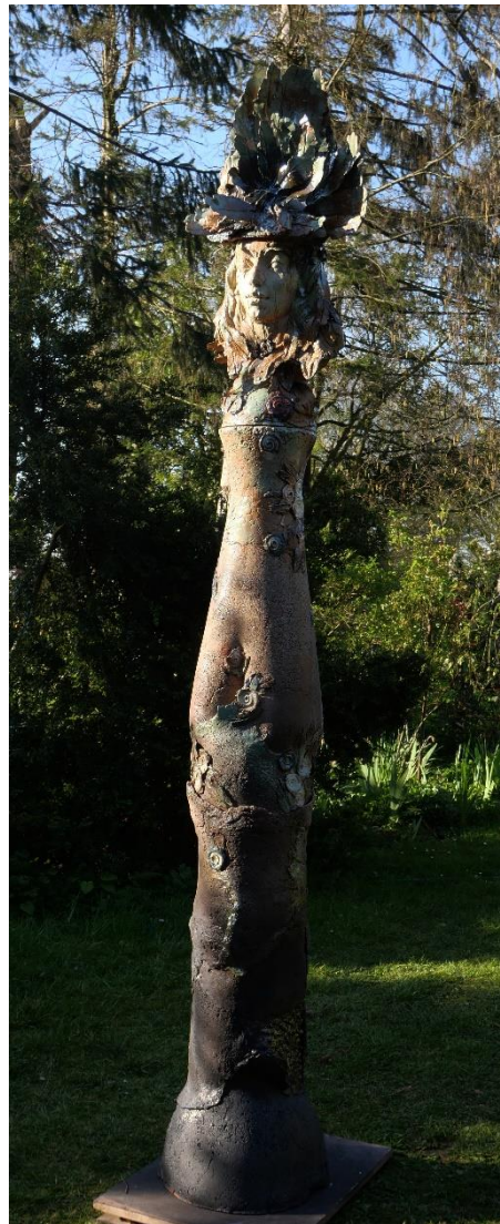
Juliette, "La Reine des Abeilles" céramique, 2m55