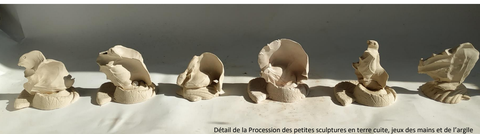
Détail de la Procession des petites sculptures en terre cuite, jeux des mains et de l'argile